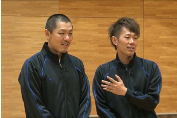
先生をやらせていただきます トータルテンボスのお兄さんたちだよ～