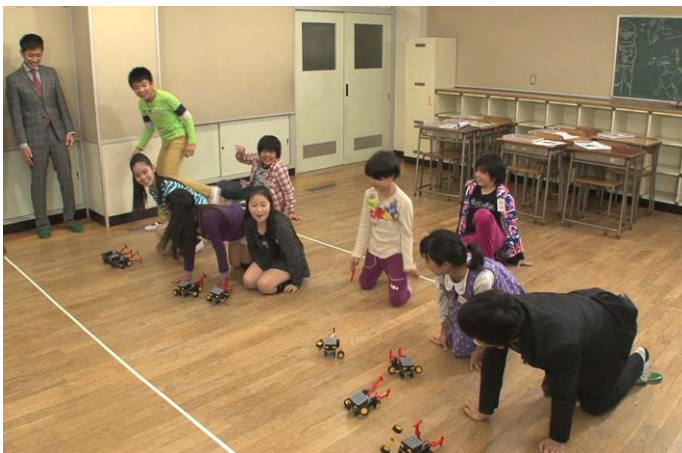
「オイ、いけー！がんばれ～！！」子ども相手に本気の菅先生