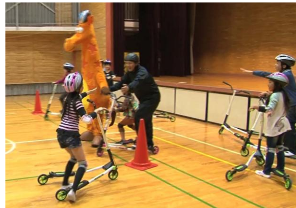
アンカーの藤田先生にバトンタッチ。勝敗の行方は！？