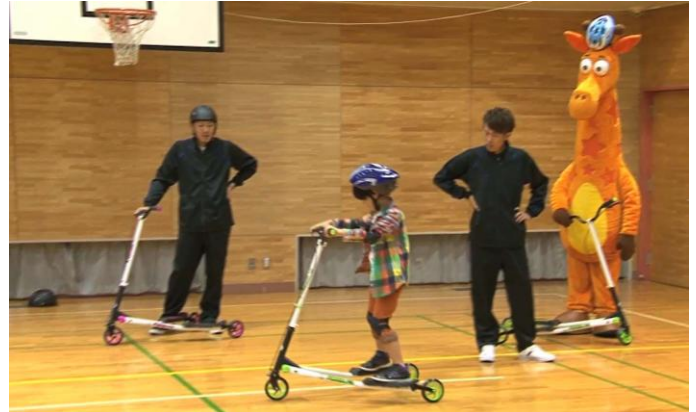
いよいよ授業開始。新感覚の乗り物「Yフリッカー」に挑戦！