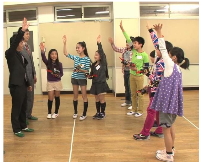
「楽しかった人、手を挙げて！」。失敗も含め、みんな楽しんだ様子