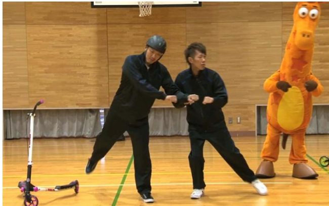
「こういう感じだよ、イメージとしては…」と生徒たちにアドバイス