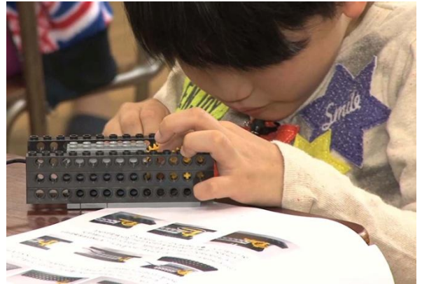
子どもたちの作る時の集中力はすごいものが