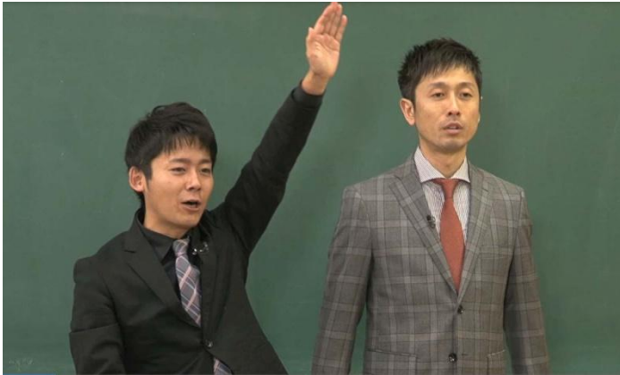
この中でロボットを作ったことがある人